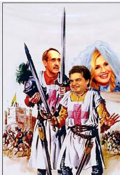
PIETRO E CICCIO I DUE CROCIATI

La legge Brunetta non ha specificatamente modificato o abrogato queste norme anche se non sono chiari i riferimenti sulla questione economica.