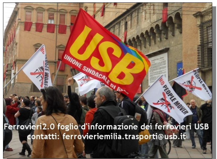
Ferrovieri2.0 foglio d'informazione dei ferrovieri USB contatti: ferrovieriemilia.trasporti@usb.it