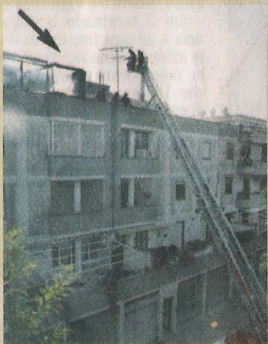
L'intervento dei vigili del fuoco