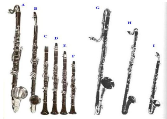
A Clarinetto basso, B Corno di bassetto in Fa, C Clarinetto in La, D Clarinetto in Sib, E Clarinetto in Do, F Clarinetto in Mib, G Clarinetto contrabbasso in Sib, H Clarinetto basso in Sib, I Clarinetto alto in Mib.